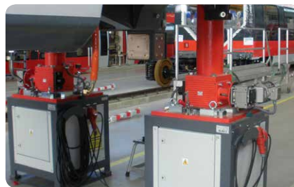
Ecklastwaage für die Prüfung von Waggons