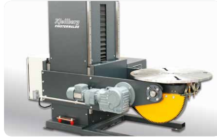
Drehkipptisch für schwere Bauteile