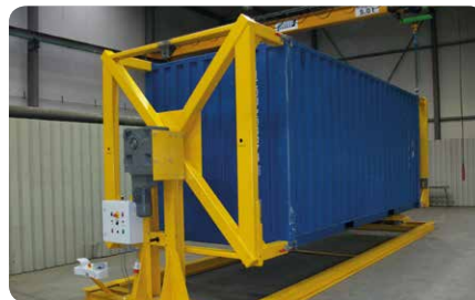
Drehvorrichtung für Container