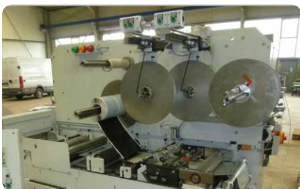
Doppelwickler für Dichtbänder