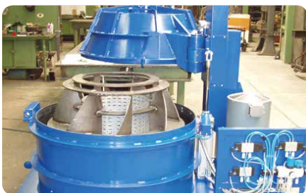
Zentrifuge für den Einsatz in der Galvanikindustrie

Wir sind in vielen Branchen zu Hause. So haben wir Elektrolytbehälter und Zentrifugen für die Galvanikindustrie gefertigt, Chargieranlagen für die Normteilerfertigung, Mess- und Prüfeinrichtungen für den Waggonbau oder Maschinen für die Konfektionierung von Baukunststoffen. Mit diesen Erfahrungen ist es nur noch ein kleiner Schritt hin zum Bau kompletter Fertigungsstraßen in der verarbeitenden Industrie.